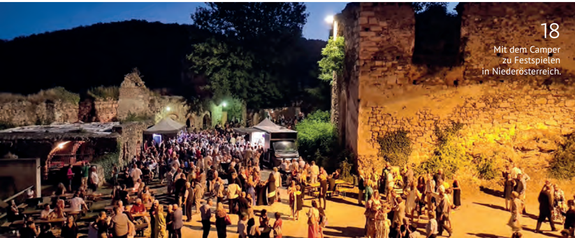
18 Mit dem Camper zu Festspielen in Niederösterreich.