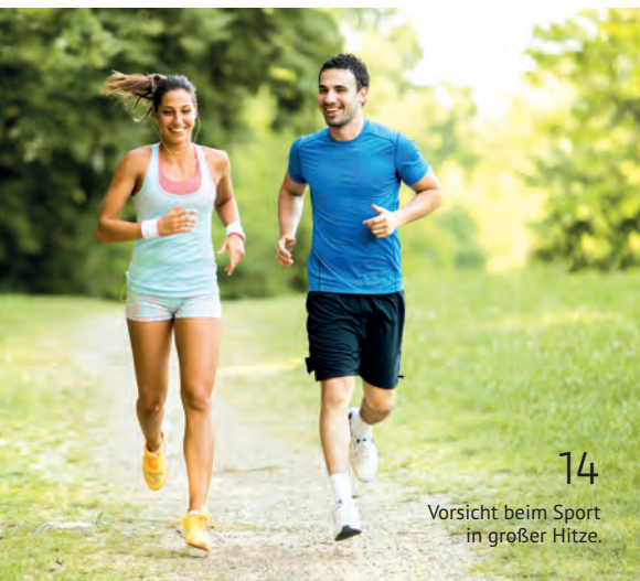
14 Vorsicht beim Sport in großer Hitze.