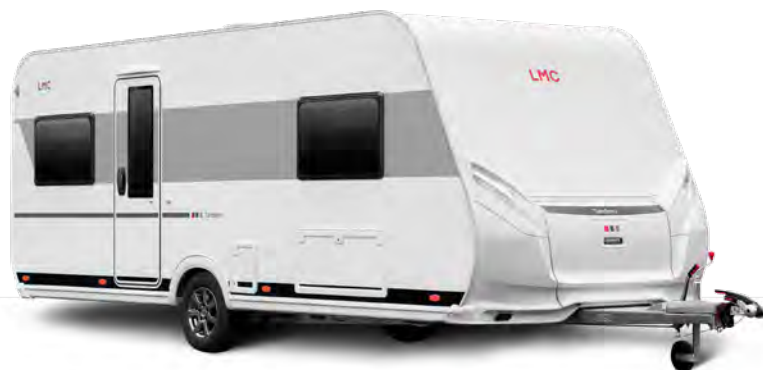
LMC Tãndero 500 E.