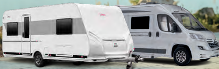
LMC Tandero 500 E