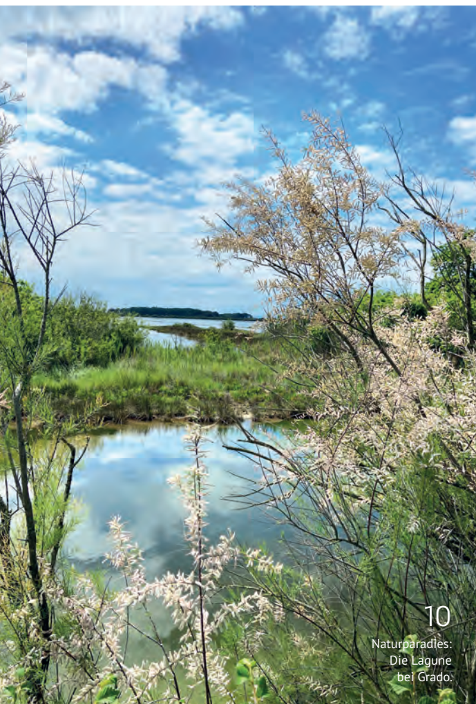
10 Naturparadies: Die Lagune bei Grado.