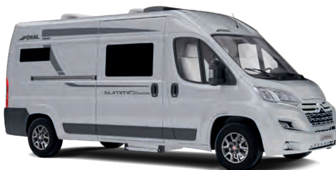
Pössl Summit Shine 600 LR