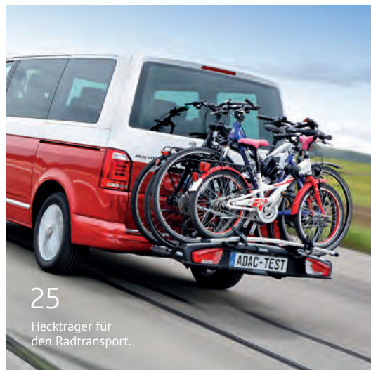
25 Heckträger für den Radtransport.