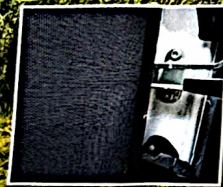
Magnetleiste im Türfalz Magnetic strip on door seam Barrettes d'aimants dans la feuillure de la porte