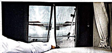
Zugang zur Fensteröffnung und Jalousie Access to the window opening and blind Accès à l'ouverture de la fenêtre et du store