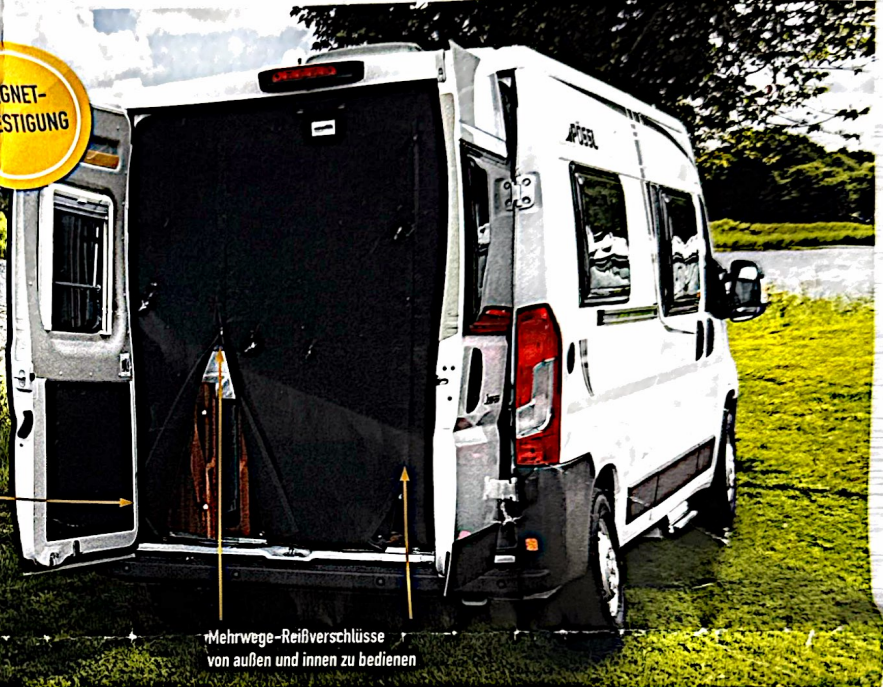
Mehrwege-Reißverschlüsse von außen und innen zu bedienen